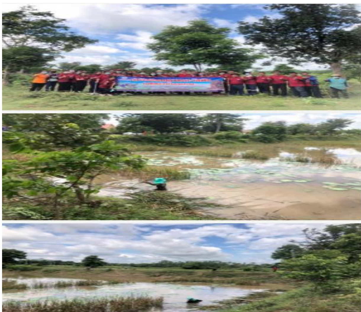
รูปภาพที่ 4.1 การกิจองค์กร โครงการกำจัดผักตบชวาและวัชพืชในแหล่งน้ำสาธารณะ

จากตาราง 4.3 ผลการศึกษากลุ่มตัวอย่างทั้งหมด 365 คน ในด้านคุณสมบัติทั่วไปของผู้ตอบแบบสอบถามจำแนกตามอาชีพ พบว่า ส่วนใหญ่มีอาชีพเกษตรกร จำนวน 316 คน คิดเป็นร้อยละ 87 รองลงมาผู้ประกอบการ/อิสระส่วนตัว จำนวน 49 คน คิดเป็นร้อยละ 13 ตามลำดับ