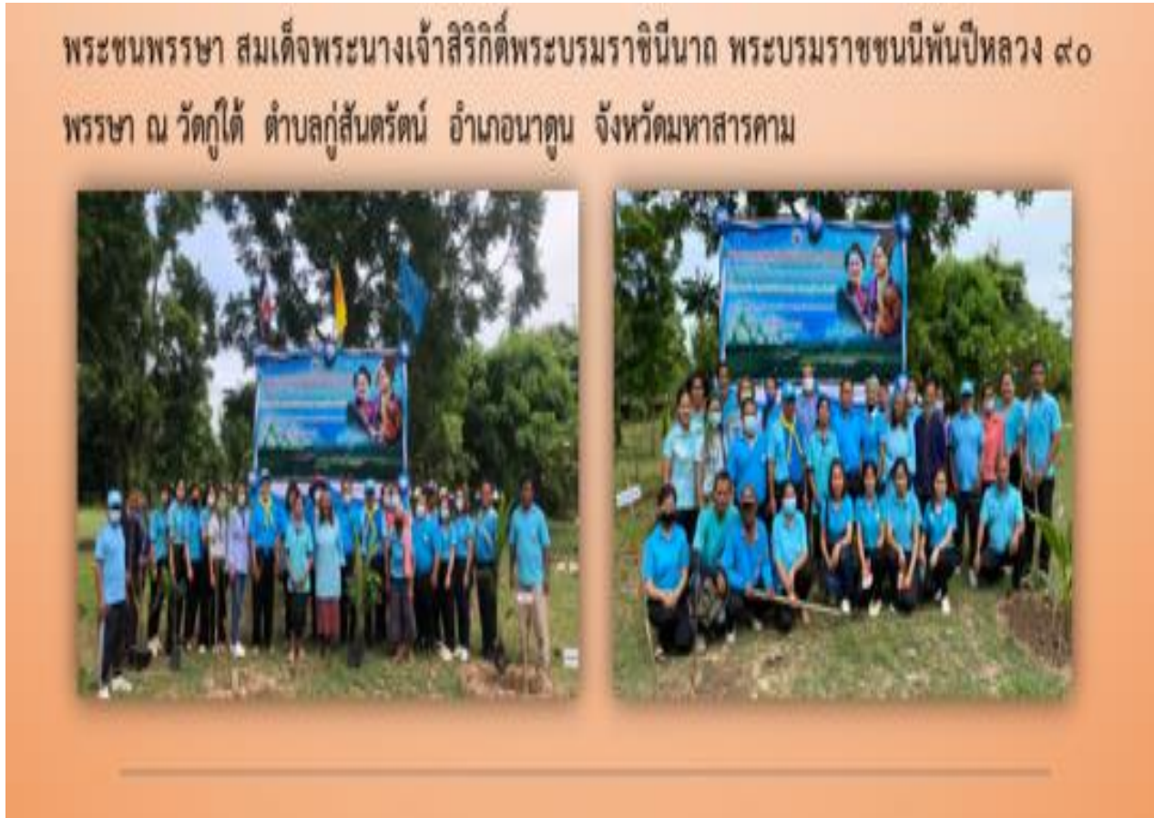
รูปภาพที่ 4.2 องค์การบริหารส่วนตำบลกุ้งสำริด พร้อมด้วยผู้บริหาร สมาชิก อบต. เจ้าหน้าที่องค์การบริหารส่วนตำบลกุ้งสำริด และประชาชนในพื้นที่ ร่วมทำกิจกรรมโครงการปลูกต้นไม้เฉลิมพระเกียรติ เนื่องในโอกาสมหามงคลเฉลิมพระชนพรพรชา สมเด็จพระนางเจ้าสิริกิติ์พระบรมราชินีนาถ พระบรมราชชนนีพันปีหลวง 90 พรรษา